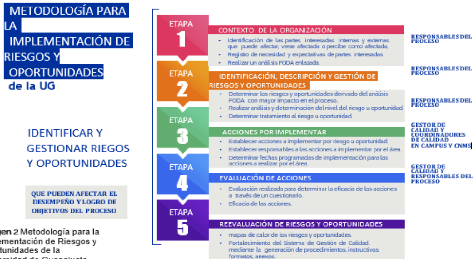
Imagen 2 Metodología para la Implementación de Riesgos y Oportunidades de la Universidad de Guanajuato.

A continuación, se presenta el resumen de la metodología de la UG para gestionar y atender riesgos y oportunidades: