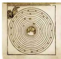
Michael Wolgemuth, Cuarto día, cuando se hizo el firmamento, 1493